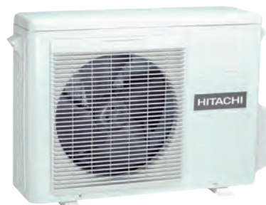
RAC-18 à 50WPB - Unité extérieure