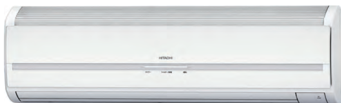
RAK - 60/70PPA-V Unité intérieure