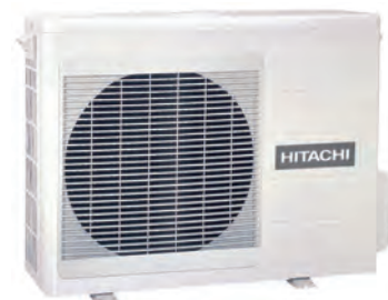
RAC-60 à 70WPA - Unité extérieure