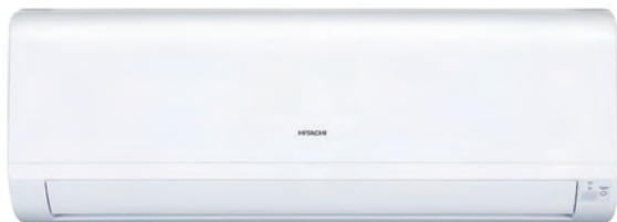
RAK-18/25/35/50RPB-V Unité intérieure